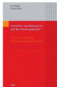
Dritte Auflage, Verlag Huber, Frauenfeld, 2009