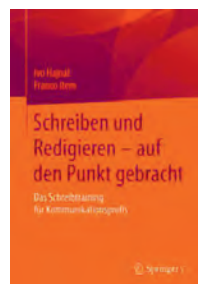
Vierte Auflage, Springer Verlag, 2023